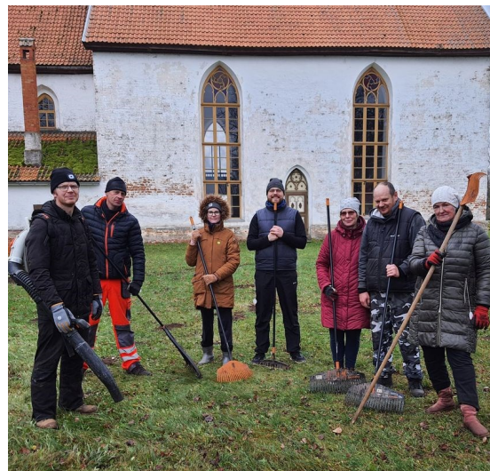
Tublid talgulised kiriku ümbrust korrastamas. 14. novembril.