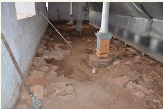
Ülesvõetud põrand.