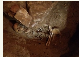
Keskaegse inimese luustik.

eas viitasid lülivaheketta songad VII–XI rinnalülil. Skeletil tuvastati kolm paranenud luumurdu. Kaks neist oli rindkere osas: parema XI roidekaare keha keskjoonepoolses osas ja vasaku XII roidekaare osas. Kolmas paranenud fraktuur oli parema V kämblaluu lähimises osas. Võimalikule traumale viitas ka vasaku õlavarreluu keskmises 1/3 eesmis-külgmises osas olnud luukasvis. Koljul avastati kolm healoomulist luukoekasvajad, millest kaks olid otsmikuluu soomusosal ja üks paremal kiiruluul. Geneetilise eripärana oli mehel 12 rinnalüli asemel