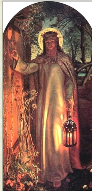
Holman Hunt. Jeesus seisab ukse taga

küsiivad mõnikord, kas Jumal tõesti ka mulle andestab? Kas ta tõepoolest koputab ka minu südame-