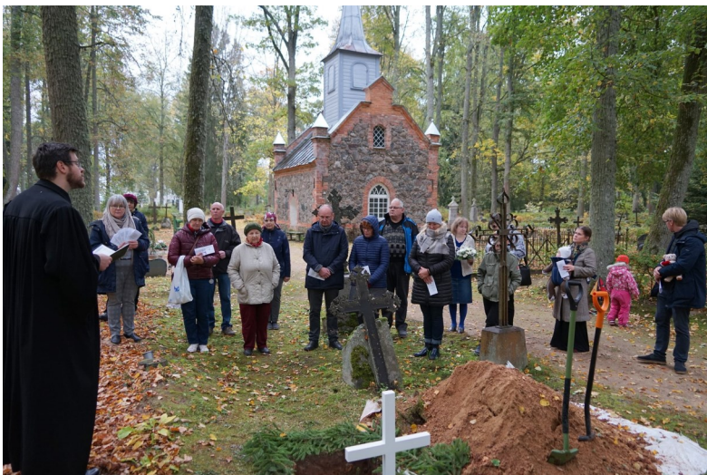
Kiriku pöranda renoveerimise käigus leitud keskaegsete säilmete ümbermatmine. Rannu kalmistul 04. oktoobril.