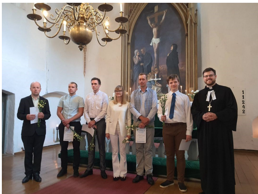
Leeripüha 5. juulil 2020.

Leeri läbimine ei ole usuelu lõpp-punkt, vaid alles algus, et hakata kasvama Jumala armus ja tundmises.