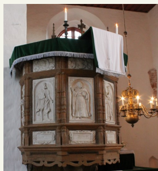
Baltimaade vanim kantsel ja Karl XII kingitud kroonlühter