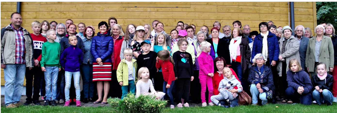
Valga praostkonna väljumalateenistusel osalenud. Limnologiajaamas 13.augustil.