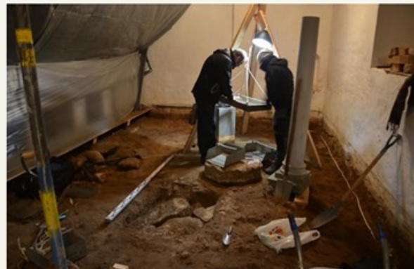
Tööde algus idapoolse postialuse juures ja vundamenti ilmumine.