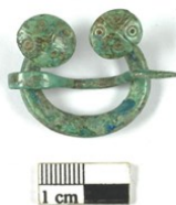
Lääne-balti aladelt pärit hoburaudsõlg.

Rannu kiriku põrand on juba aastaid olnud avariilises seisus puudumädaniku ja seenkahjustuste tõttu. Neljandik põrandast vahetati sel aastal välja tänu PRIA Leader-meetmele, mida vahendas MTÜ Võrtsjärve Ühendus. Töid teostas Liivimaa Lossid OÜ ja arheoloogilisi uuringuid koordineeris Heiki Valk. Kiriku põranda alt leiti hulgaliselt haruldasi münste (vt lk 6), sh ainulaadne 13. saj Tartu penn ning siinmail haruldane, ilmselt 13. saj leedulaste röövretkest pärit hoburaudsõlg.